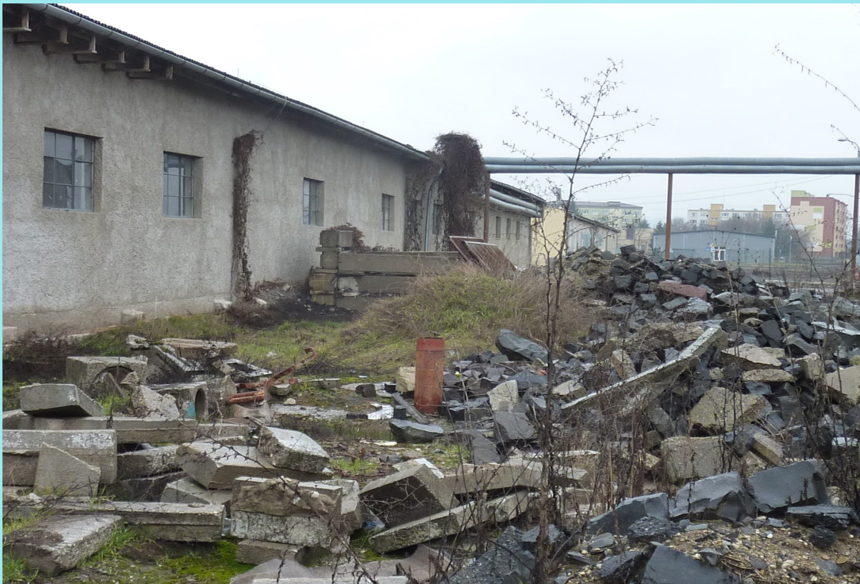
Baráky a garáže v Rimavskej Sobote