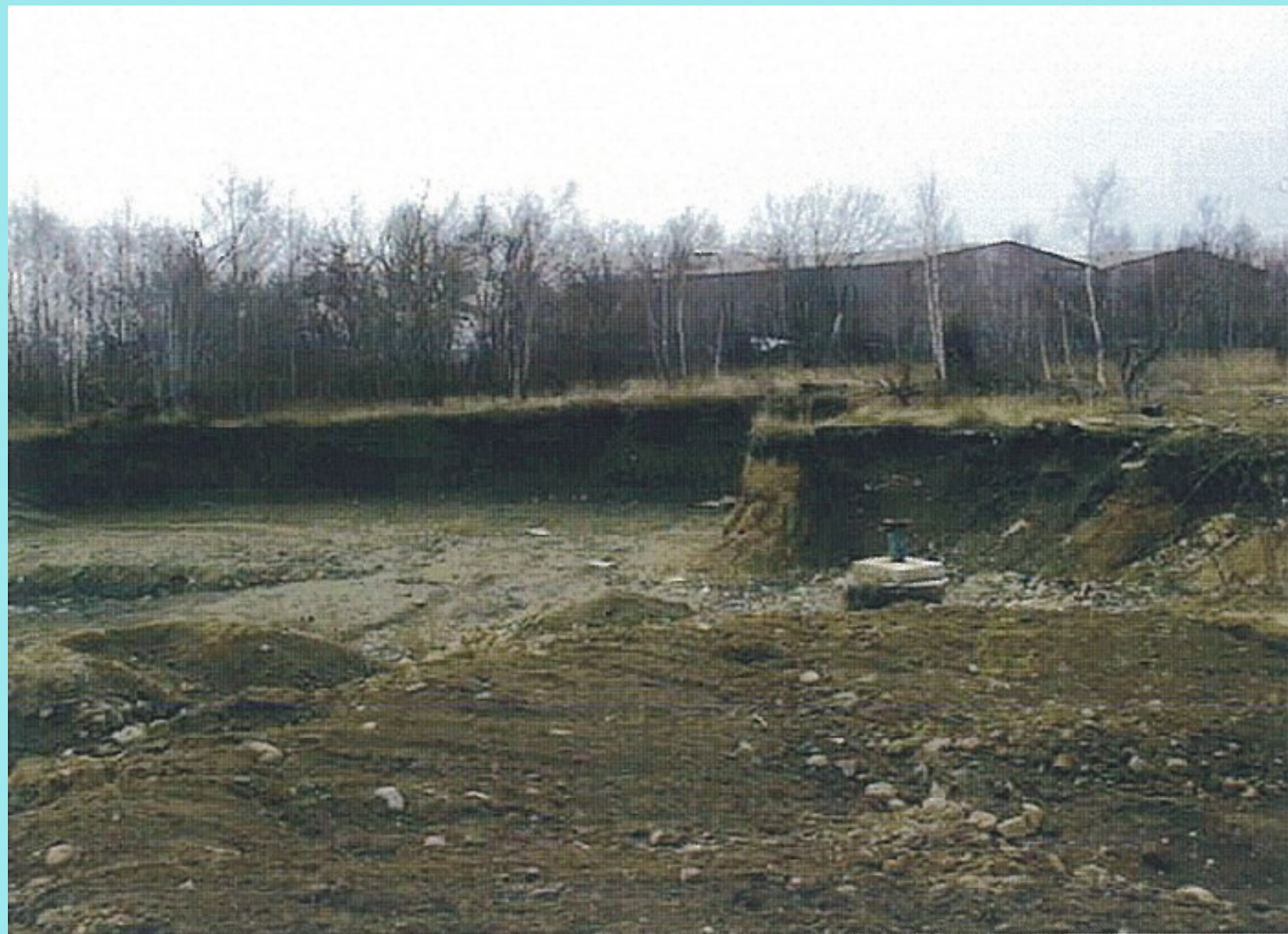
VVP Lešť – sklad PHM po odstránení nádrží