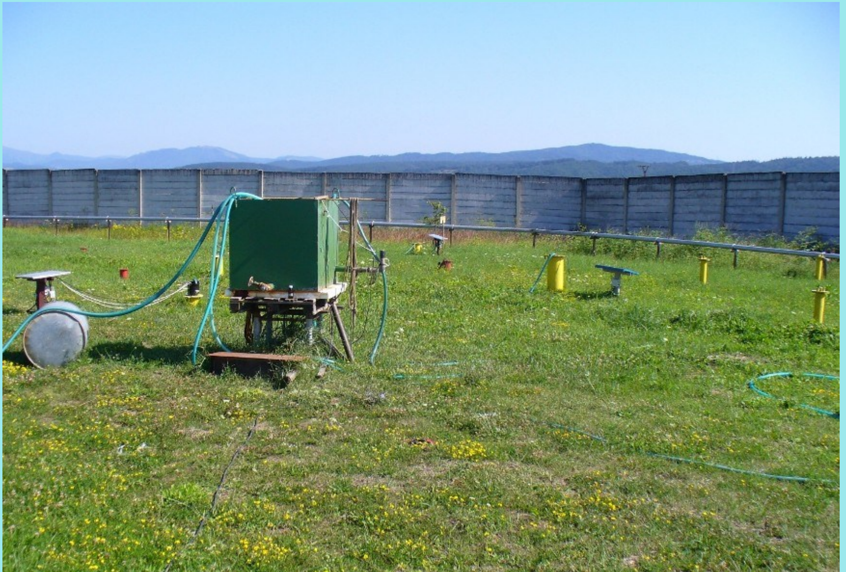
Sliač (sanácia zemín in situ)